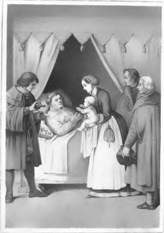
Lithogr. v. Deuker & Solmann in Utrecht in Dordrecht.